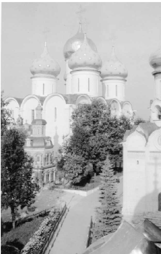
Троице-Сергиева Лавра до «реконструкции»

Написать это письмо подвинула меня сердечная боль за все, что происходит сейчас в Троице-Сергиевой Лавре.